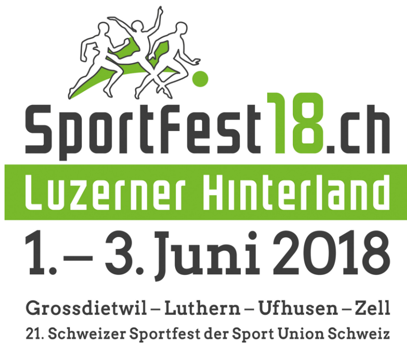
Logo Sportfest 2018