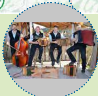
Eröffnungsabend FR: «Echo vom Schwandbode»