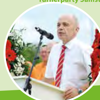
Der Luzerner Regierungsrat Guido Graf und Bundesrat Ueli Maurer werden am Sonntag in Zell bei der Schlussfeier mit dabei sein.