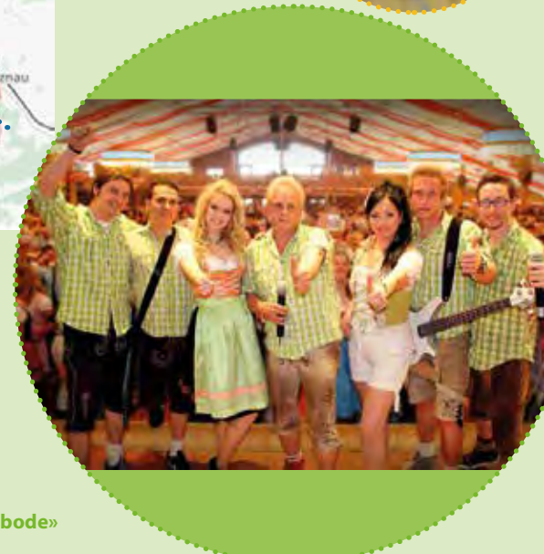
Turnerparty Samstag: «Die Grafenberger»